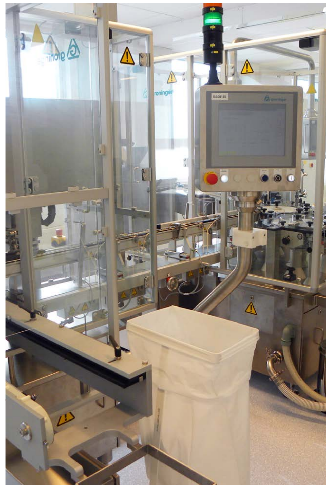
ChloraSolv tillverkas på Biora AB i Malmö.

Utbildning: Civilingenjör (Master of Science Industrial Automation) Tidigare uppdrag: Independent Consultant på Essity och Fingerprint Card (2017–2021). Project Manager, Manager Project Management och Director Project Management Office på Mölnlycke Health Care AB (2002–2016).